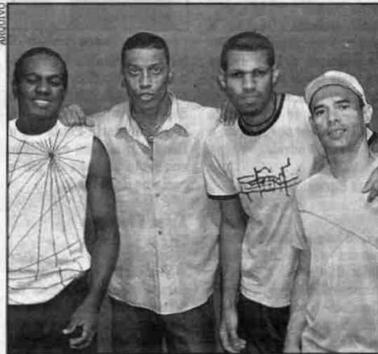
O grupo Sampa Crew se apresenta ao lado de MCs da região